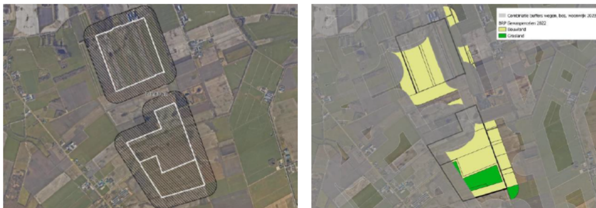
Figuur 3 Verstoringscontour van 150 meter rond het projectgebied (links) en onverstoord foerageergebied na toepassing van de verstoringscontouren voor wegen en bosranden.

Vervolgens is voor dit onverstoord gebied de oppervlakte aan geteelde gewassen bepaald op basis van de Basisregistratie Gewaspercelen (BRP), waarbij de meest recente cijfers voor 2022 zijn gebruikt. Hieruit blijkt dat er zich hierbinnen 1,76 ha grasland bevindt en 76,5 ha bouwland. De voor ganzen en zwanen relevante gewassen hierbinnen en hun capaciteit zijn in onderstaande tabel weergegeven. Binnen het areaal is ruim 9 ha aan grasland met een agrarisch natuurmengsel aanwezig. Dit graslandtype is in de beoordeling van het foerageergebied rond het Fochteloërveen niet meegenomen en is daarmee ook hier buiten beschouwing gelaten.