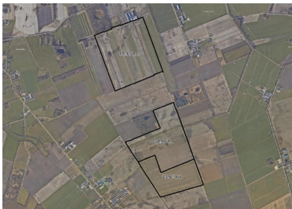
Figuur 2 Ligging van het projectgebied Zonnepark Zuidvelde.

Ten zuidwesten van Zuidvelde is een zonnepark gepland (zie Figuur 2). Zonnepark Zuidvelde is een toekomstig zonnepark van op initiatief van Chint Solar, TPSolar en Ankehaar Solar. Het zonnepark beslaat 109 hectare, waarvan 35 hectare aan natuur en open ruimte en 74 hectare aan zonnepanelen. In de huidige situatie omvat het projectgebied hoofdzakelijk bouwland. Na uitvoering zal het niet meer geschikt zijn als foerageergebied.